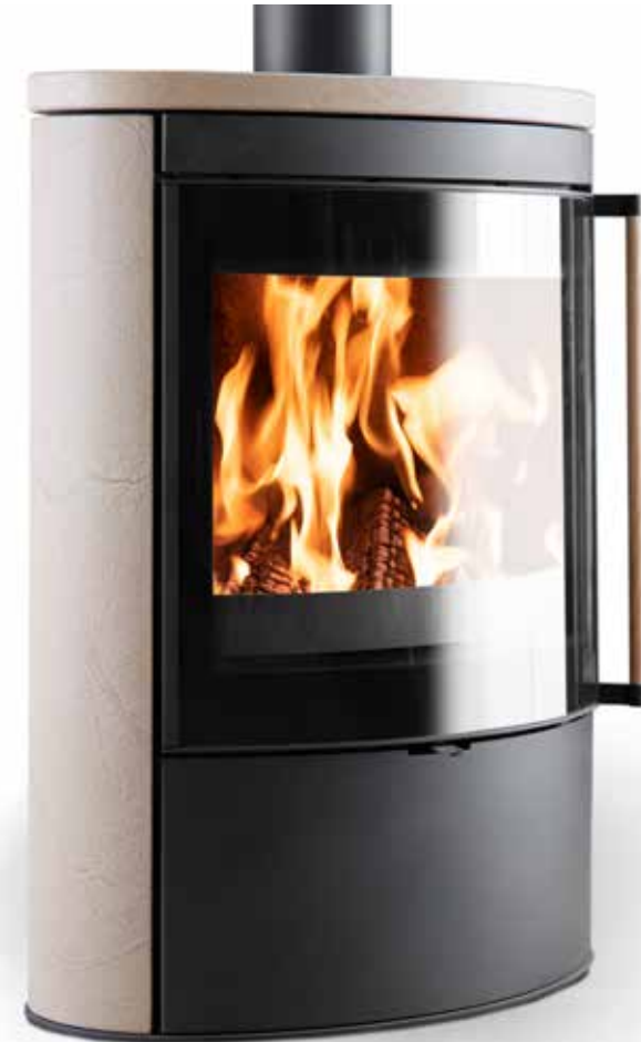
→ Nero Golden Sand