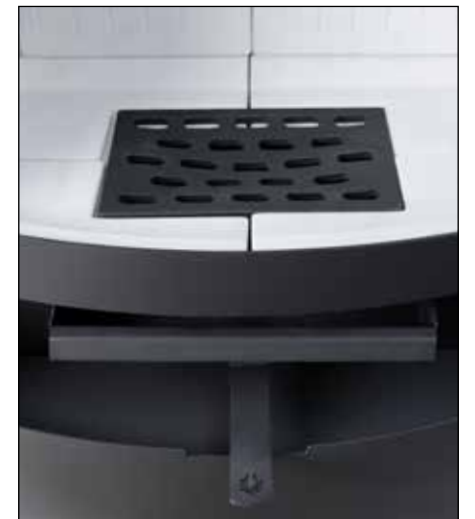
→ Gussrost, Aschekasten, Luftregler