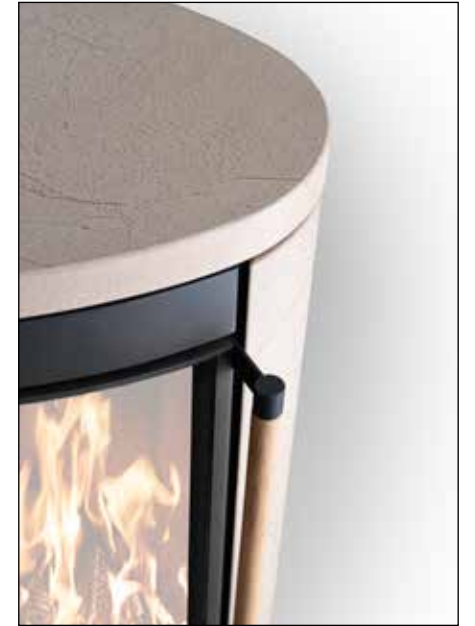
→ Türgriff aus edlem Holz, Speicherkeramik