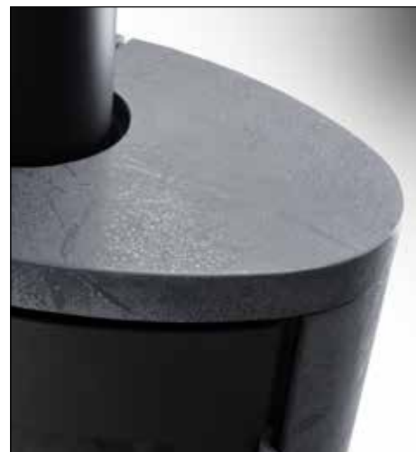
„Black Forest“ Speicherkeramik