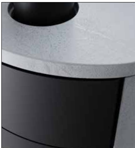
„Grey Rock“ Speicherkeramik