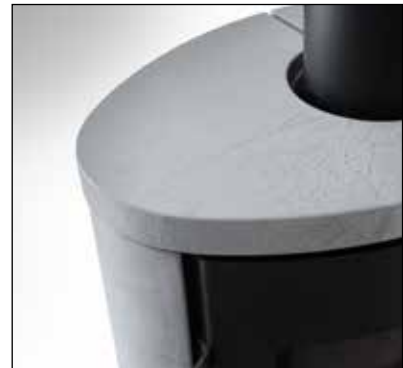
„Grey Rock“ Speicherkeramik

Behagliche Wärme, die den Winter besiegt