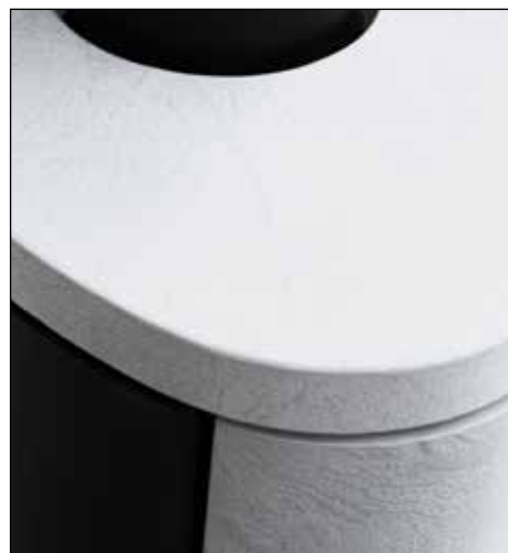
„White Mountain“ Speicherkeramik