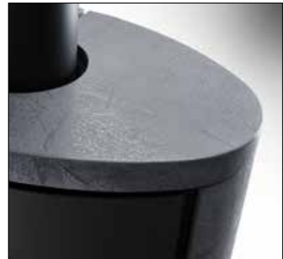
„Black Forest“ Speicherkeramik