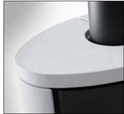
„White Mountain“ Speicherkeramik