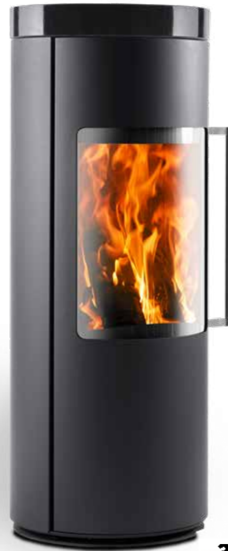
Topplatte aus Shanxi Black