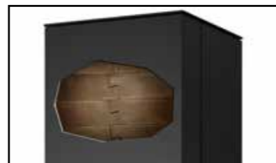
AMS Speicherblock Accumulation Modul System

Durch das Accumulation Modul System (AMS), ein optionaler hochentwickelter Speicherblock aus Feuerbeton, wird eine äußerst effiziente Wärmespeicherung erzielt. Das AMS erreicht nach einer 3 stündigen Heizphase bis zu 140°C. Nach 6-8 stündiger Abkühlphase kann das AMS immernoch etwa 50°C messen. Dadurch eignen sich Kaminöfen mit AMS-Technologie hervorragend als Nacht-Speicheröfen.