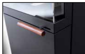
Griff aus edlem Holz