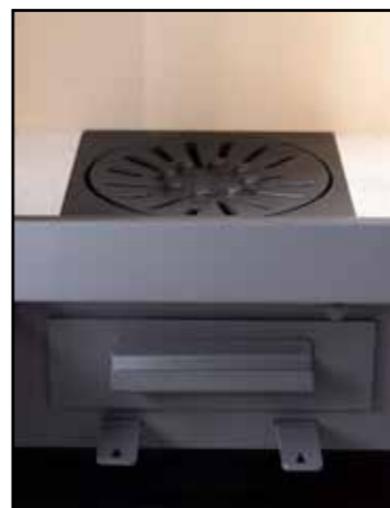
Brennkammer, Aschekasten, Luftschieber