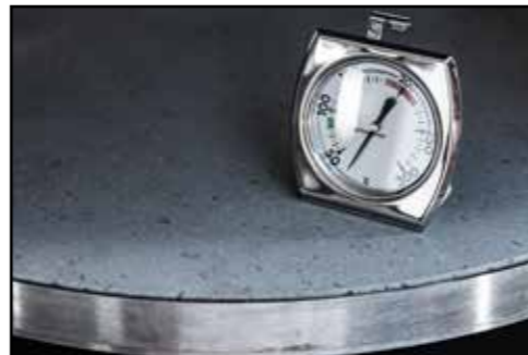
Thermometer, Edelstahlschale mit Lavastein