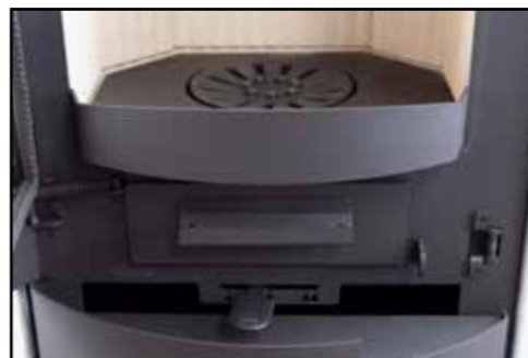
Feuerrost, Aschekasten, Luftregler