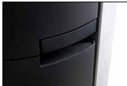
Feuerraum Griff, Holzfachtüre