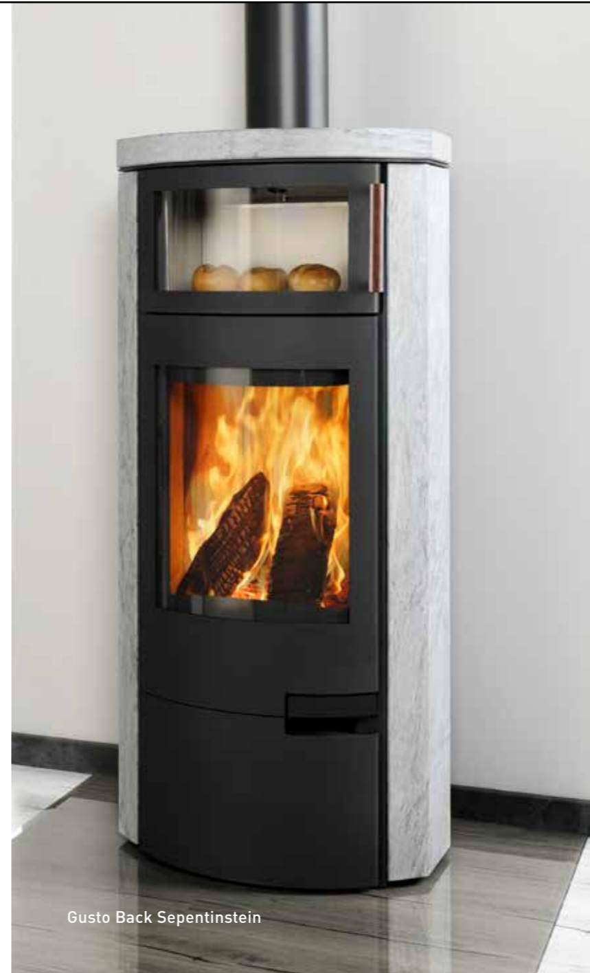
Gusto Back Sepentinstein