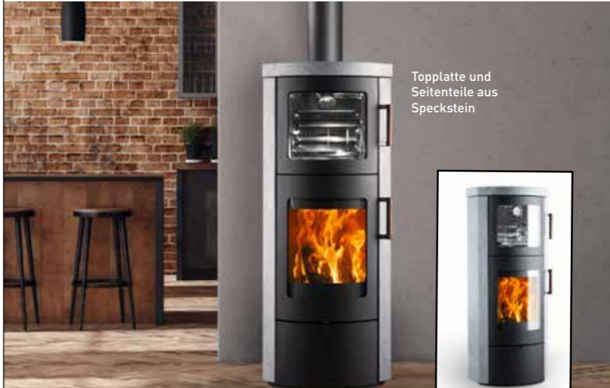
Topplatte und Seitenteile aus Speckstein