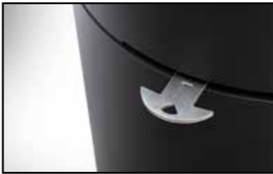
Luftregler aus Edelstahl

Maße (H x B x T) 1430 x 460 x 460 mm Nennwärmeleistung 6 kW (Mittelwert) Abgasstutzen 150 mm Abgasanschluss oben / hinten Gewicht ca. 171 kg Abgastemperatur ca. 235°C Mindestförderdruck 11 Pa Raumheizvermögen ca. 140 m 3 Wirkungsgrad 81 % Feuerraum (H x B x T) ca. 400 x 300 x 320 mm Brennstoff Holz, Braunkohlebriketts Ext. Luftanschluss 125 mm (hinten)