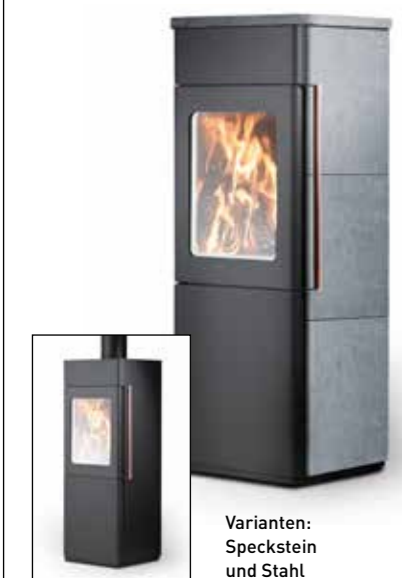
Varianten: Speckstein und Stahl

Maße (H x B x T) 1200 x 435 x 430 mm 1224 x 435 x 430 mm Nennwärmeleistung 7 kW (Mittelwert) Abgasstutzen 150 mm Abgasanschluss oben Gewicht ca. 110 kg / 190 kg Abgasmassenstrom 7,2 g/s Abgastemperatur ca. 321°C Mindestförderdruck 12 Pa Raumheizvermögen ca. 140 m 3 Wirkungsgrad 75 % Feuerraum (H x B x T) ca. 350 x 270 x 300 mm Brennstoff Holz, Braunkohlebriketts Ext. Luftanschluss 100 mm (hinten / unten)