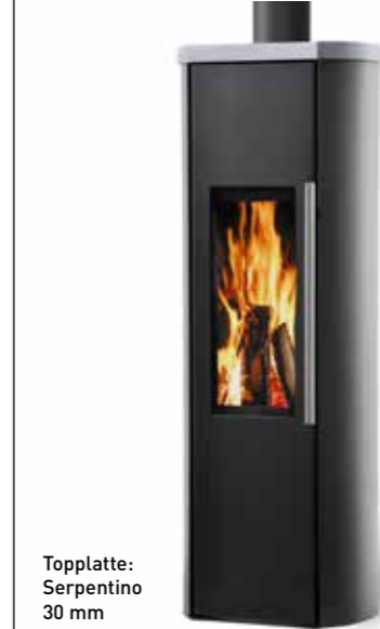
Topplatte: Serpentino 30 mm

Maße (H x B x T) 1100 x 390 x 343 mm Nennwärmeleistung 4 kW (Mittelwert) Abgasstutzen 120 mm Abgasanschluss oben / hinten Gewicht ca. 110 kg Abgasmassenstrom 3,9 g/s Abgastemperatur ca. 200°C Mindestförderdruck 12 Pa Raumheizvermögen ca. 90 m 3 Wirkungsgrad 84,3 % Feuerraum (H x B x T) 380 x 250 x 230 mm Brennstoff Holz, Braunkohlebriketts Ext. Luftanschluss 100 mm (hinten / unten)