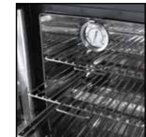
Backraum mit Thermometer