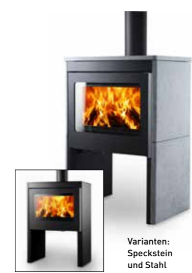
Varianten: Speckstein und Stahl

Maße (H x B x T) 1053/1076 x 750 x 502 mm Nennwärmeleistung 8 kW (Mittelwert) Abgasstutzen 150 mm Abgasanschluss oben / hinten Gewicht ca. 130 / 220 kg Abgasmassenstrom 8,9 g/s Abgastemperatur 312°C Mindestförderdruck 12 Pa Raumheizvermögen ca. 160 m 3 Wirkungsgrad 80 % Feuerraum (H x B x T) 300 x 550 x 380 mm Brennstoff Holz, Braunkohlebriketts Ext. Luftanschluss 100 mm (hinten)