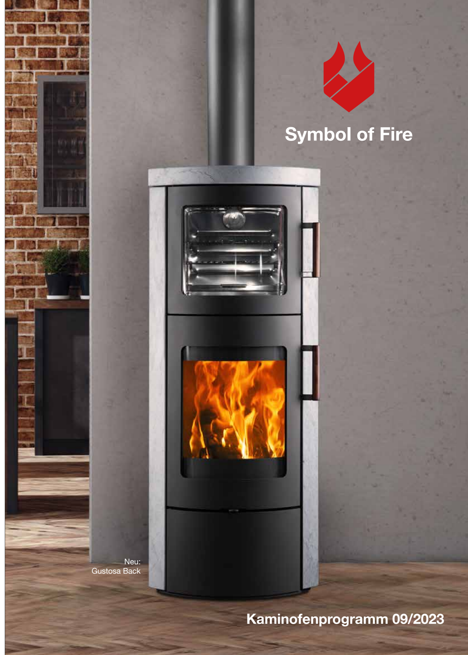
Neu: Gustosa Back