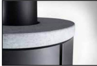
Topplatte aus Serpentino